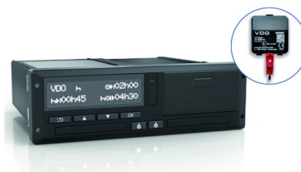
Inteligentný tachograf verzie 1